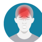
Dolor de cabeza